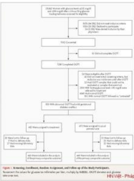
Figure 1. Screening, Enrollment, Random Assignment, and Follow-up of the Study Participants. To convert the values for glucose to millimoles per liter, multiply by 0.0555. OGTT denotes oral glucose tolerance test.