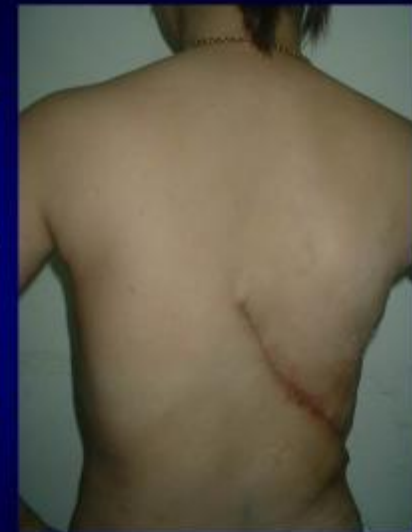
Sau mổ (tái tạo bằng vạt LD)