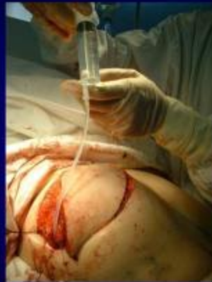
Đặt túi nước dưới vạt