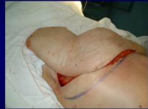
Định hình tuyến vú (cách 2)