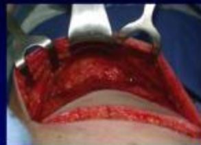
Vùng 1 và 2