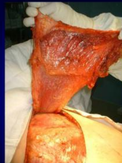
Vạt đã được bóc tách

Delay E. The Breast, Principles and Art , 2nd edition, Lippincott Williams & Wilkins, pp. 631-655.