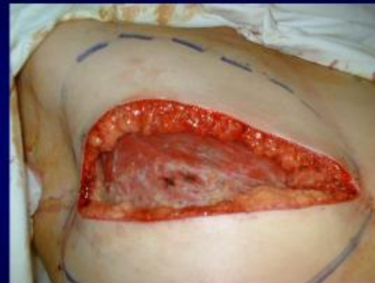
Bóc tách sẹo mổ cũ