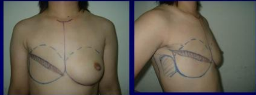
Vẽ trước mổ