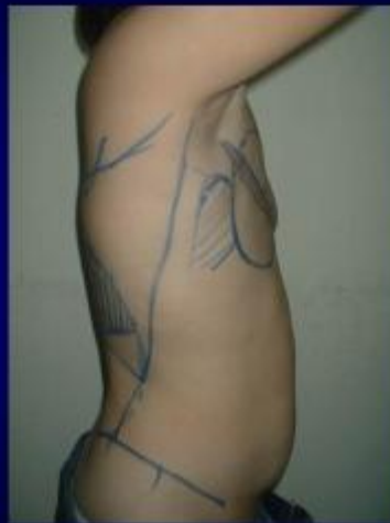
Vẽ trước mổ