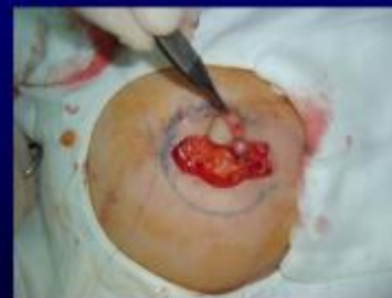
Tái tạo núm vú