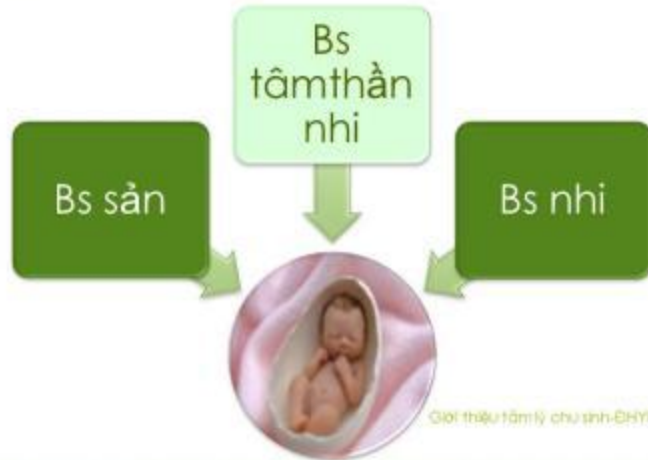
Giới thiệu tâm lý chu sinh-DHY/PNT