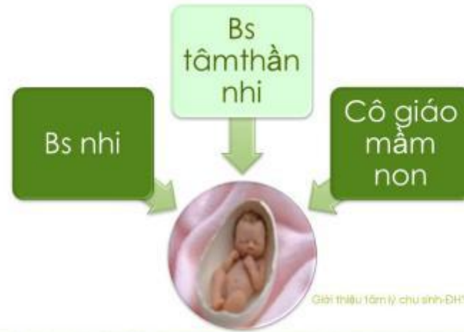
Giới thiệu tâm lý chu sinh-DHY/PNT