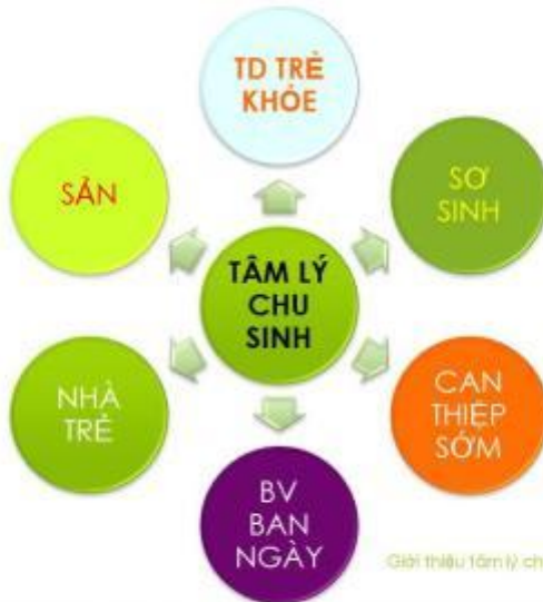
Giới thiệu tâm lý chu sinh-DHY/PNT