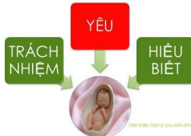
Giới thiệu tâm lý chu sinh-DHY/PNT