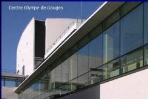
Centre Olympique de Gougues