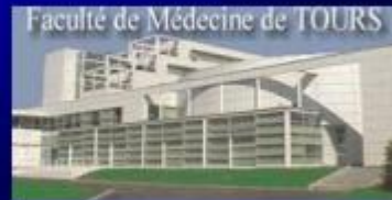
Faculté de Médecine de TOURS

Pôle de gynécologie obstétrique, médecine fœtale, reproduction et génétique CHRU de TOURS FRANCE