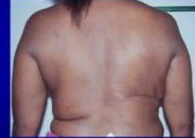
Résultat à 1 an